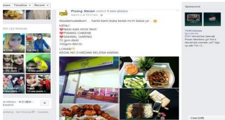
Caption : Promosi di media sosial facebook (gambar &amp; harga)