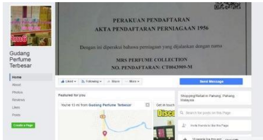
Caption : Page Facebook beliau (Gudang Perfume Terbesar)