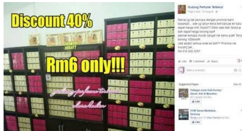
Caption : Salah satu promosi beliau di dalam facebook untuk menarik minat pelanggan