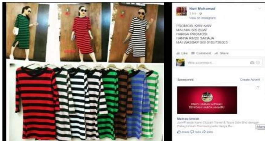
Caption : Antara promosi (jualan murah) yang diadakan untuk para pelanggan beliau