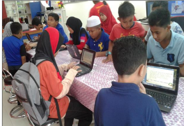
Para pertandingan Rapid Typing