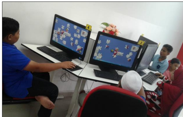
Pertandingan menyusun puzzle online bertemakan bulan kemerdekaan